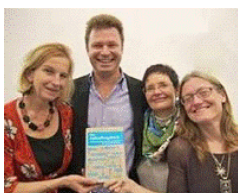
Das Autorenteam auf der BUCH WIEN

Sigmund Freud Museum - Buchleseerlebnisabend mit Aufstellung (Essenz, ca. 12 Minuten), 22.10.2012: http://youtu.be/q_TuH-v-z94