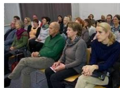
Lesung im Freud Museum